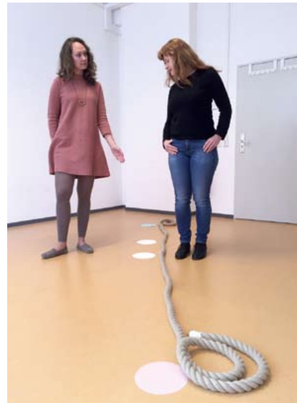
Abb. 3: Die Skalierungsfrage, wahrnehmungszentriert mittels Seil